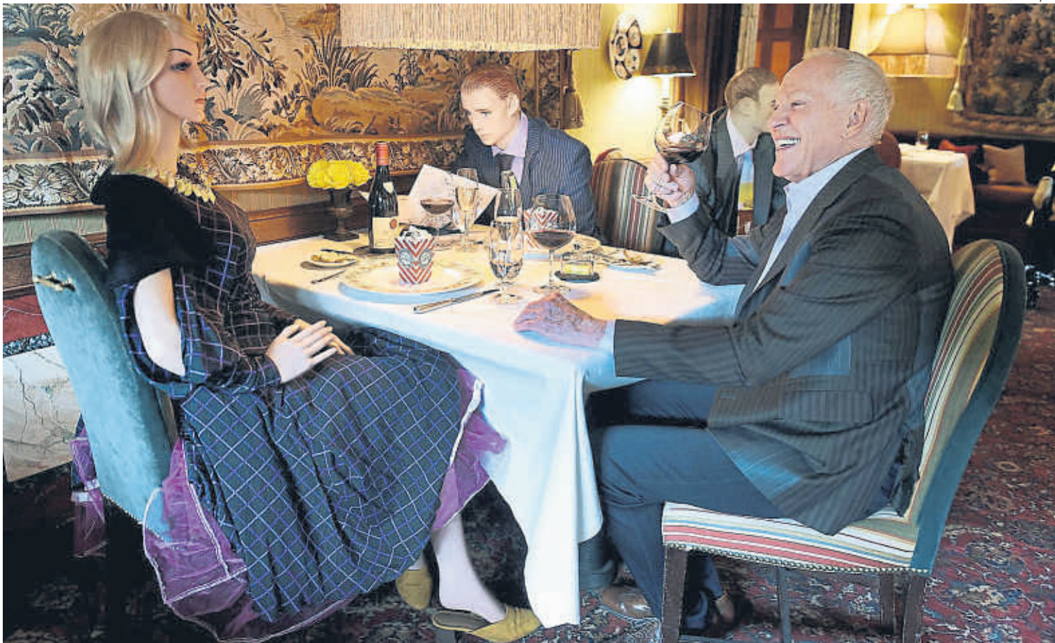
UNA COMPANYIA INUSUAL. Establiments i restaurants com el del prestigiós xef Patrick O'Connell a Washington estudien innovadores fórmules com la presència de maniquins a les taules per atenuar l'impacte del coronavirus en el dia a dia.