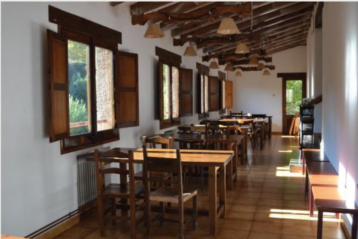
Menjador de l'alberg Els Caus, de Mura (Bages), un dels projectes finançats per Acció Solidària Contra l'Atur.

Acció Solidària contra l'Atur (ASCA) va tancar l'exercici de l'any passat havent concedit 226 micro préstecs per un total de 842.000 euros a projectes amb l'objectiu de crear ocupació digna. L'entitat, creada el 1981, fa, doncs, 37 anys que atorga crèdits sense interessos per ajudar persones –sigui a través de societats limitades, cooperatives o altres fórmules jurídiques– que volen emprendre noves activitats que suposin la creació de llocs de treball per tal de lluitar contra l'atur.